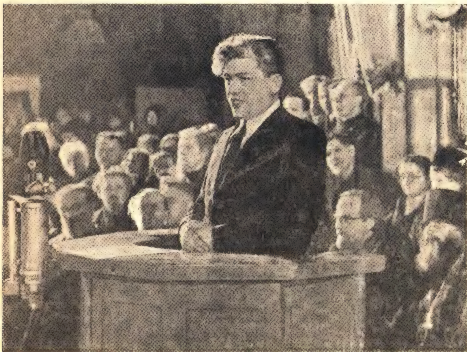
Председатель Совета по делам Русской Православной Церкви при СНК СССР Г. Г. Карпов произносит речь на заседании Собора 31 января

Правительство Союза Советских Социалистических Республик уполномочило меня передать настоящему Высокому Собранию от имени Правительства приветствие и наилучшие пожелания успешной и плодотворной работы по устройству высшего церковного управления.